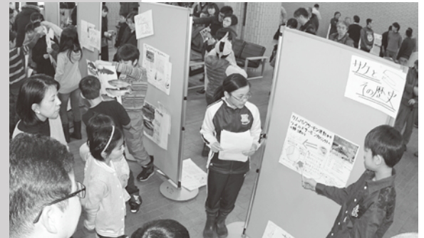
SWSP市民フォーラム2017会場でポスター発表する小学生たち